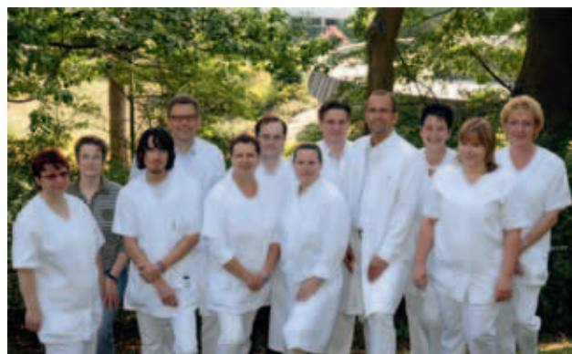
Das orthopädische Team (Ärzte, Psychologin und Pflegepersonal)

Chronische Erkrankungen beeinträchtigen nicht selten die psychische Verfassung. Daher steht bei Bedarf eine psychologische Behandlung mit verhaltenstherapeutischen Ansätzen zur Verfügung. Sie umfasst therapiebezogene Gruppenangebote und wöchentliche Einzelgespräche.